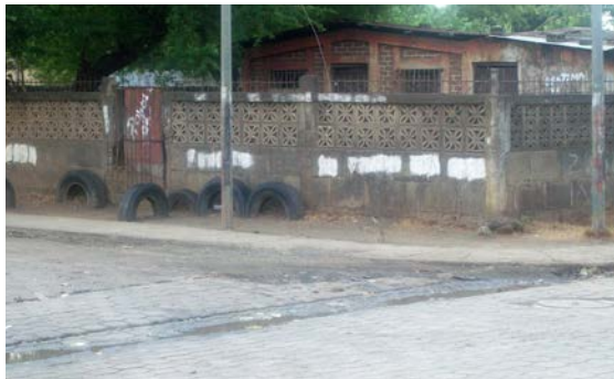
Esquina contigua al parque de la Zona 6

“El primer segmento de jóvenes vulnerados está en correspondencia a la existencia de algún ámbito de exclusión social...provocado por un evento coyuntural; el segundo segmento de jóvenes vulnerables se refiere a los casos donde el sujeto identifica un inminente o probable riesgo social o alguna privación a futuro....pasando a engrosar el segmento de los excluidos”. (Palau, 2004, pág. 24)