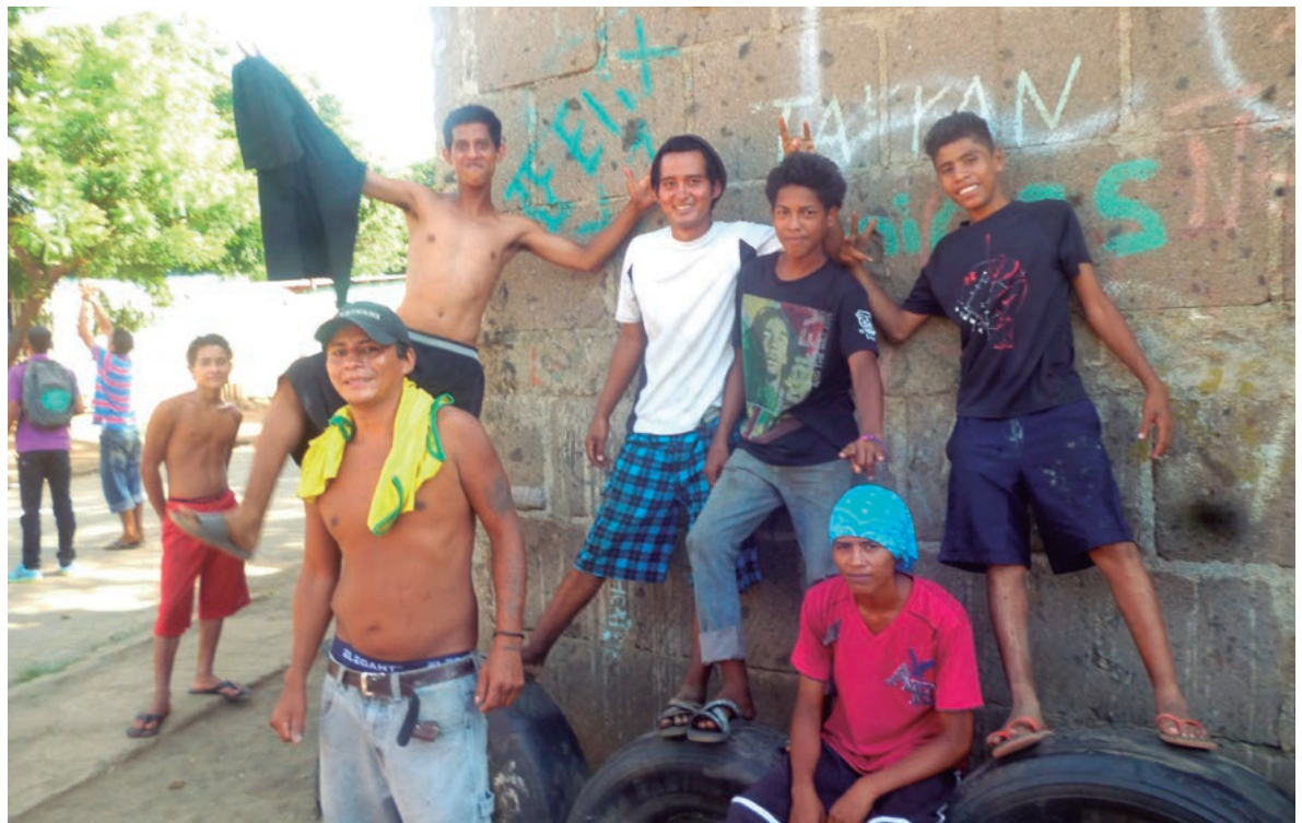
Jóvenes en situaciones de riesgo

Por otro lado ya sea que estamos hablando de jóvenes en riesgo o jóvenes delictivos, lo cierto es que en la zona de estudio el empleo de estas etiquetas y de muchas otras más hacen que la población se termine olvidando de que antes de ser chavalos vagos, pintas o inclusive jóvenes en riesgo, son simplemente jóvenes y que por tanto no se debe perder esta perspectiva en relación a quiénes son estos grupos de personas que por uno u otro motivo llámese social, económico o familiar, se encuentran en situaciones de vulnerabilidad social.