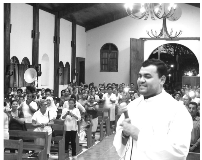
Parroquia de San José de la ciudad de Buenos Aires.