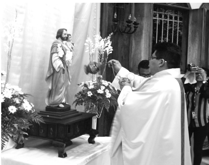
Monseñor Luis Vallejo del obispado de Granada bendice la nueva imagen de San José.

Las fiestas patronales concluyeron con una misa solemne presidida por el obispo de Granada, el 19 marzo. A San José se le confiere la custodia de la Iglesia católica.