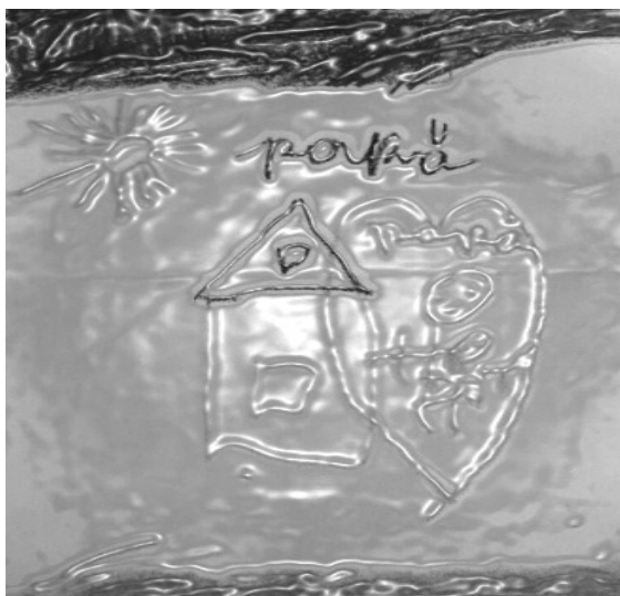
Imagen No. 1 Dibujo de Abril en el que la unión de padre e hija están sintetizadas dentro de un corazón. Véase la casa de Abril y de papá.

Pero de algo debés estar muy segura: eres simplemente bella.